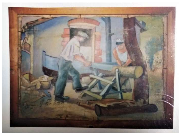
Particolare quadro bifacciale (fronte e retro) di Pietro Rosa

Valutato altresì che sarebbe necessario, a mio giudizio, riprendere l'idea della Pinacoteca Comunale dove, assieme ad una mostra permanente, calata ad esempio sul tema particolare della rappresentazione del paesaggio, possa essere prevista una sala a disposizione per mostre temporanee ed altre attività, sfruttando anche il contributo che può derivare dall'utilizzo della multimedialità per la conoscenza e divulgazione delle peculiarità del nostro territorio, della sua storia e della sua natura e tradizioni;