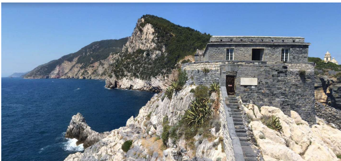
Vista esterna del Castelletto Genovese - “Vistetta”