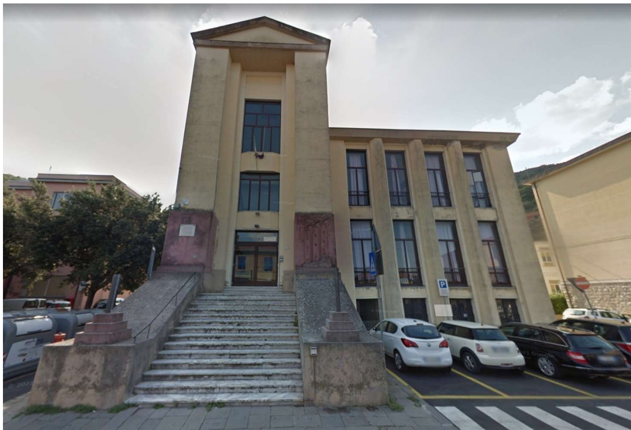
Scuola Primaria Giuseppe Garibaldi delle Grazie

INTERROGAZIONE URGENTE: “PROBLEMATICHE RELATIVE ALLA SCUOLA PRIMARIA G. GARIBALDI DELLE GRAZIE E AD ALTRI PLESSI PRESENTI SUL TERRITORIO COMUNALE”