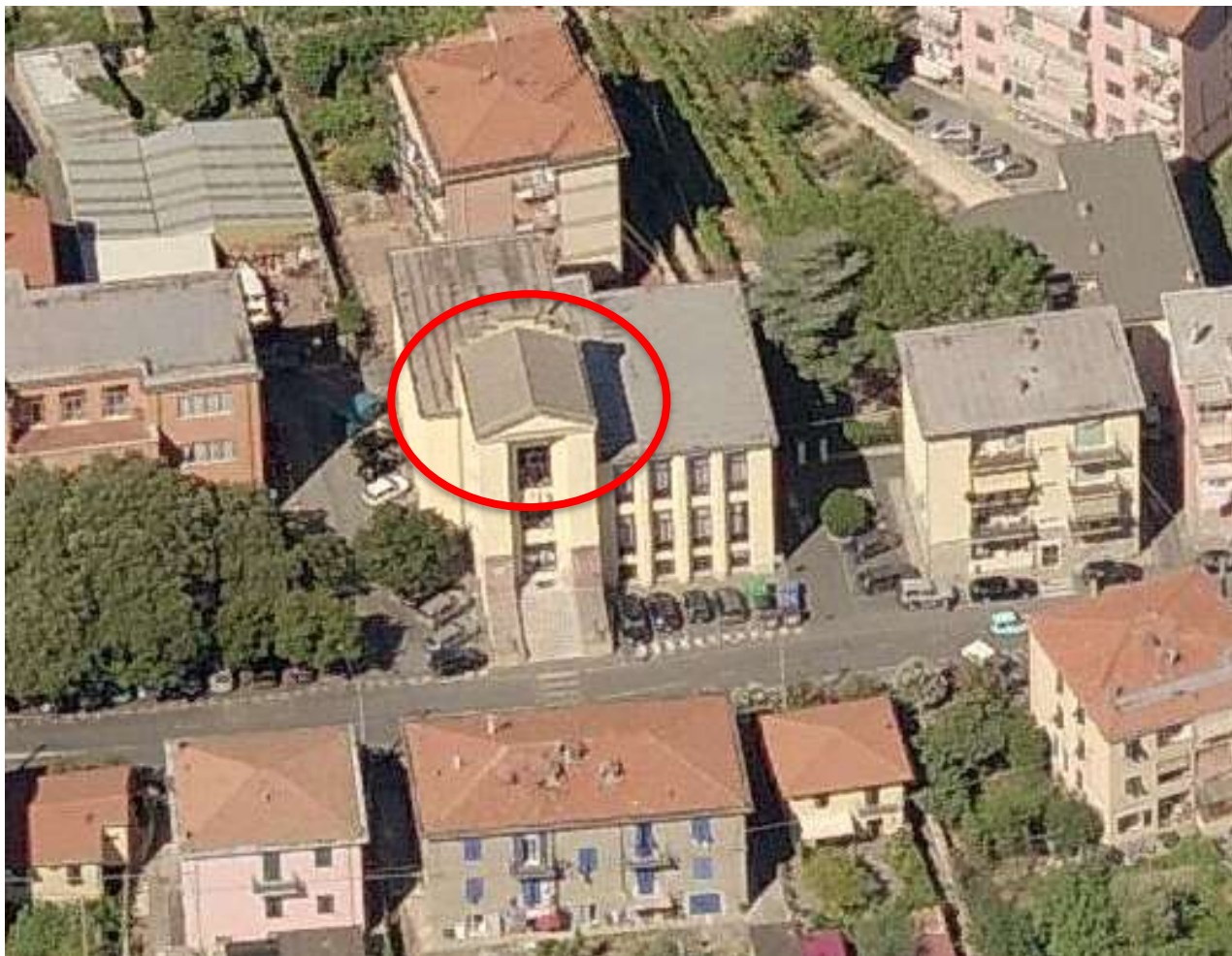
Nell'ellisse rosso il tetto della scuola con fibre d'amianto

In particolare con la presente interrogazione si vuole risollevere il problema relativo alla copertura in fibrocemento contenente fibre di amianto, già oggetto di precedente segnalazione da parte di cittadini e di conseguente perizia eseguita nell'anno 2013 oltre a successiva interrogazione presentata come Gruppo Consigliare "Bene Comune" nel dicembre 2018;