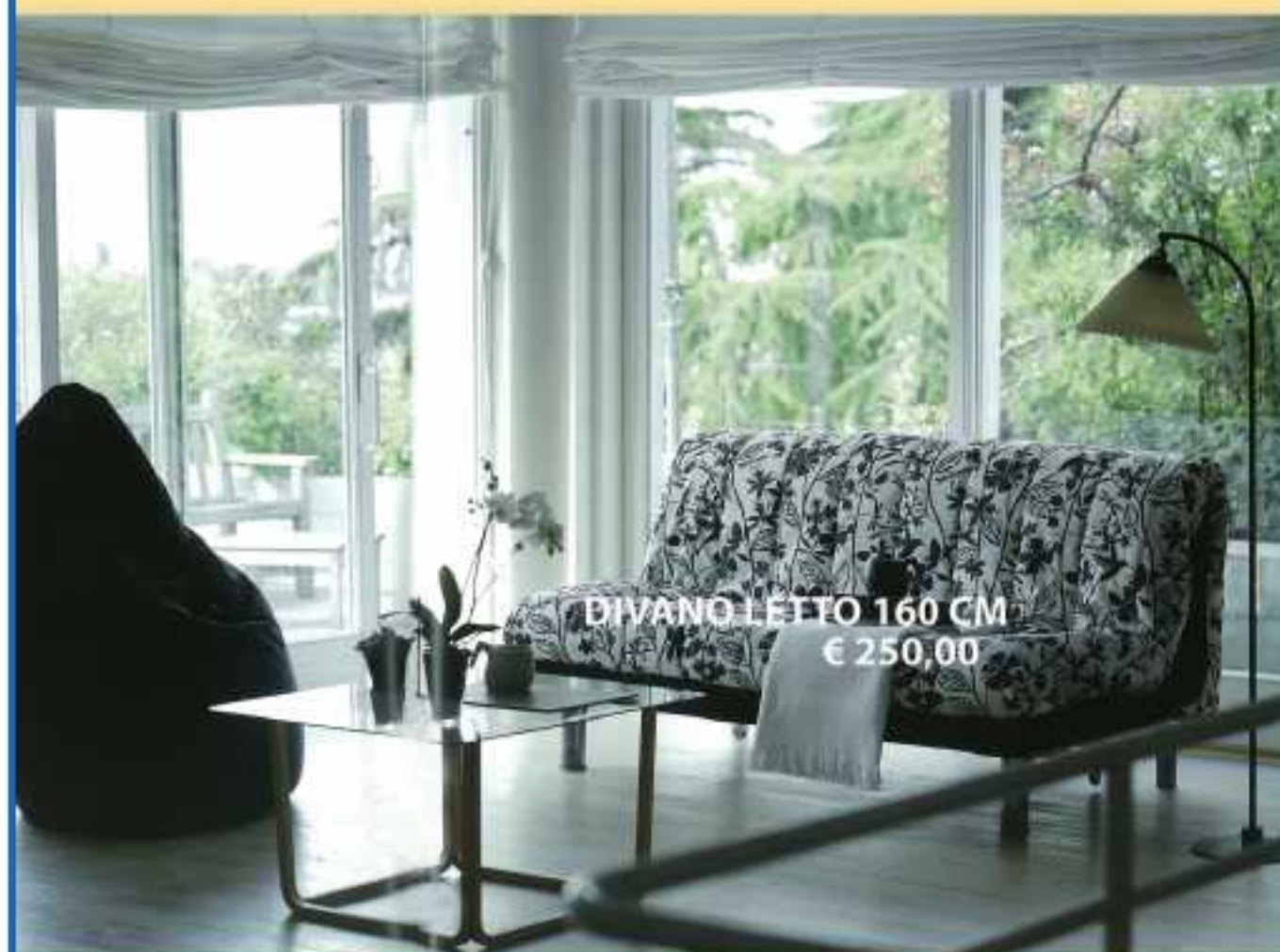
DIVANO LETTO 160 CM € 250,00

www.mobilimasella.eu Via Provinciale Piana Bottagna Tel 0187 991010