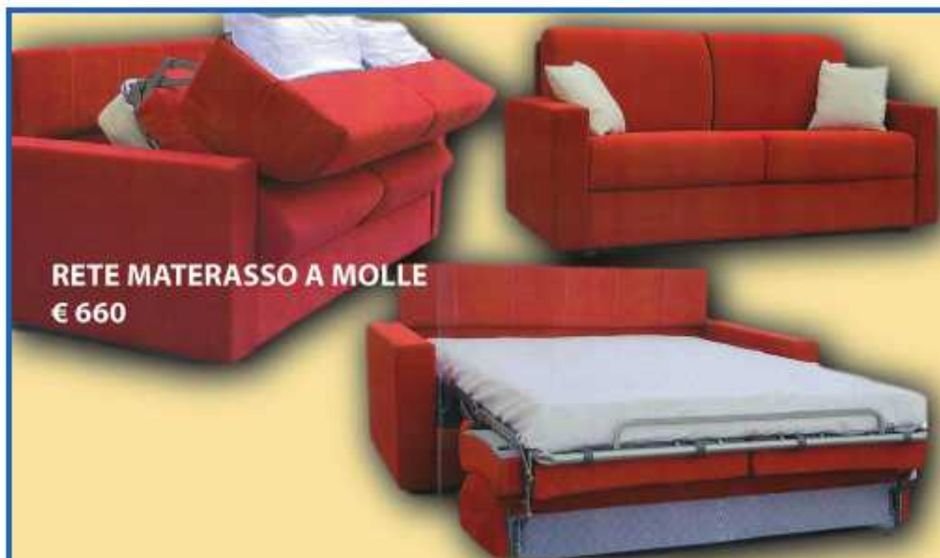
RETE MATERASSO A MOLLE € 660

LA SPEZIA - Tel 0187 520383 www.evoluzionededesign.net