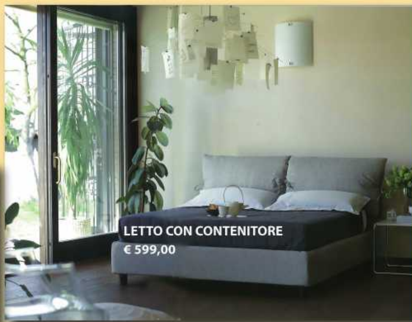
LETTO CON CONTENITORE € 599,00