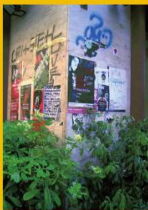
Via Prione all'angolo con la salita Quintino Sella, nel lato opposto a quello immortalato nella fotografia precedente, qui a sinistra.