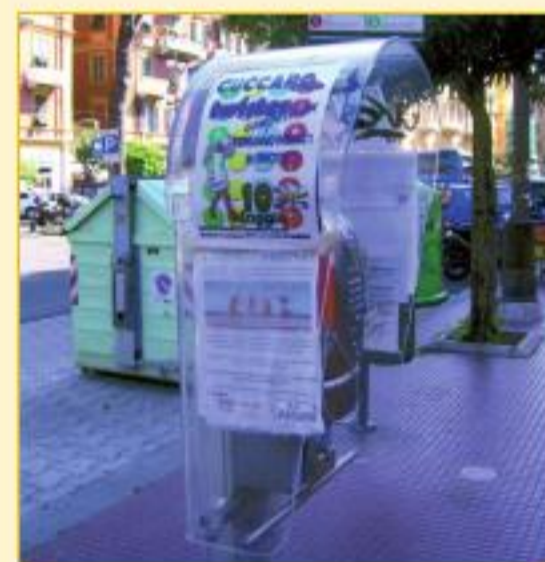
Telefono pubblico in piazza Verdi, davanti al palazzo delle poste.