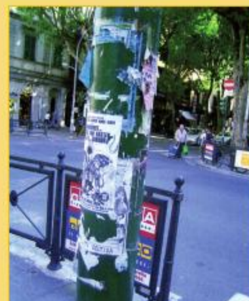
Corso Cavour angolo viale Garibaldi, davanti alla filiale del l'istituto bancario San Paolo. È una delle zone più frequentate della città (pensate al venerdì, con il mercato), quindi un posto pregiato per comunicare.