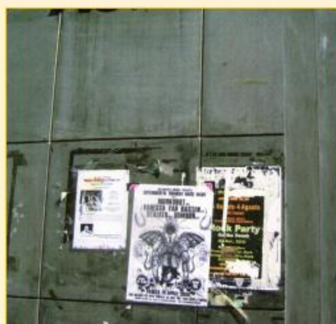
Corso Cavour nei pressi della sede della Cassa di risparmio di Genova e Imperia