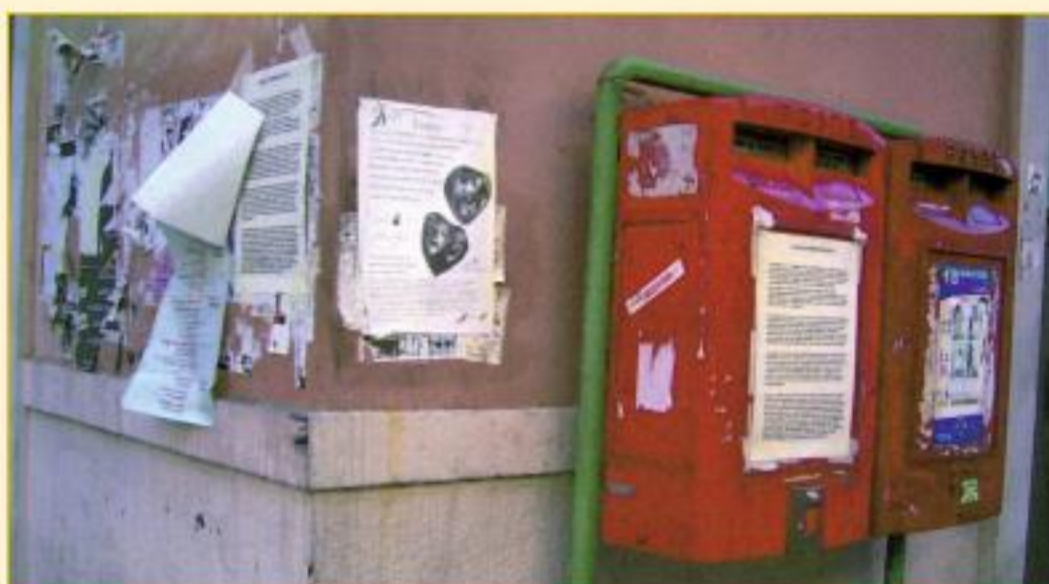
Via Prione all'angolo con via Cavallotti: il massimo della comunicazione vecchia maniera.