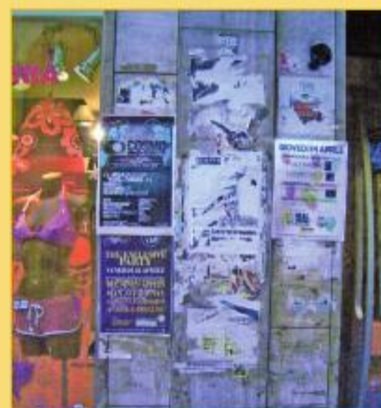
Un'opera d'arte stratta in via Prione nei pressi del Museo Diocesano.