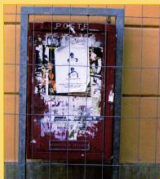
Una cassetta delle poste multiuso nella via del Prione.