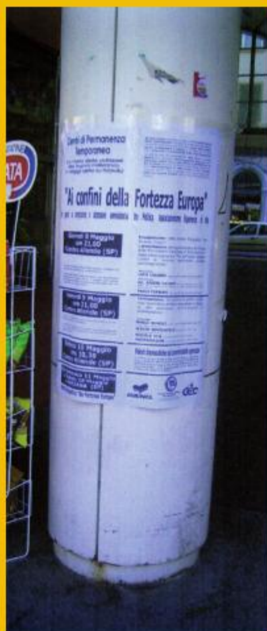
Colonna di piazza Cavour: quando si dice di informazione circolare...