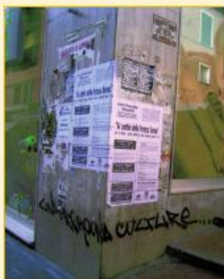
Via Prione angolo salita Quintino Sella