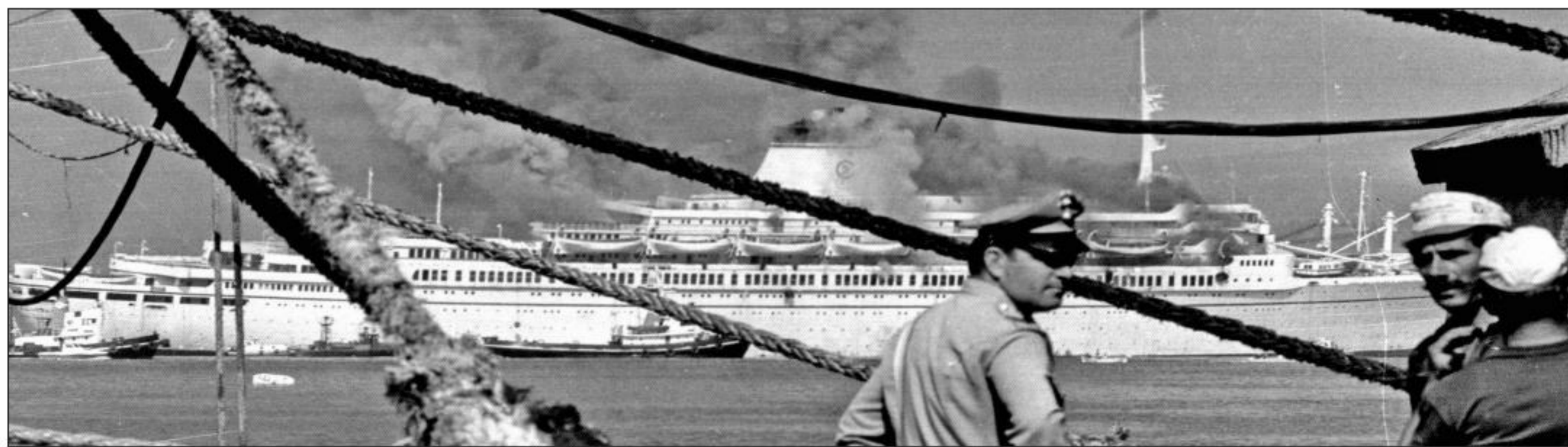
Foto tratte da una mostra di Mauro Frascatore tenutasi a Genova e a Portovenere

Le "stelline" superstiti, come l' Ausonia , e la stessa Marconi , riarmata e trasformata in nave da crociera, hanno continuato a brillare ancora per qualche tempo di luce propria, finché anche per esse non è venuta una notte di San Lorenzo.